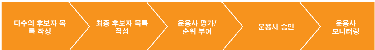
그림 3: AustralianSuper의 운용사 선정 및 모니터링 절차

아래는 AustralianSuper의 운용사 선정 접근법을 보여주는 도표입니다.