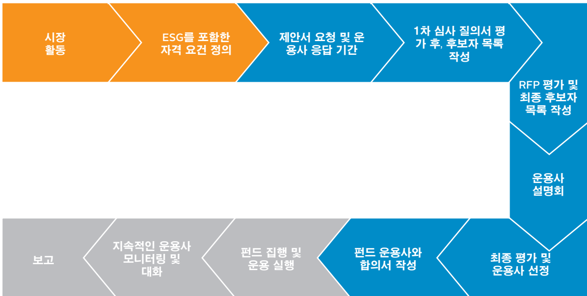
그림 2: NEST의 운용사 선정 절차

NEST는 운용사 선정 과정의 첫 단계에서 ESG 관련 요건을 정의하였습니다. ESG 관련 문항이 첫 심사 질의서, RFP, 그리고 운용사와의 1차 회의에 포함되었습니다.